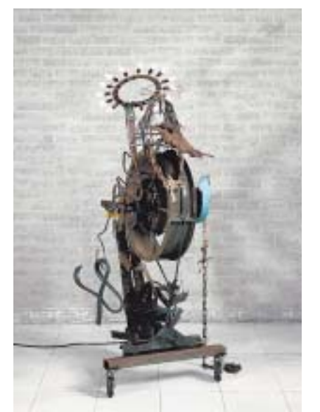
Motorisierte Kunst: Jean Tinguelys bewegliche Skulptur von 1989 steht im Zentrum der neuen Ausstellung.

Ausstellungsdauer: 26. Januar bis 24. Juni.