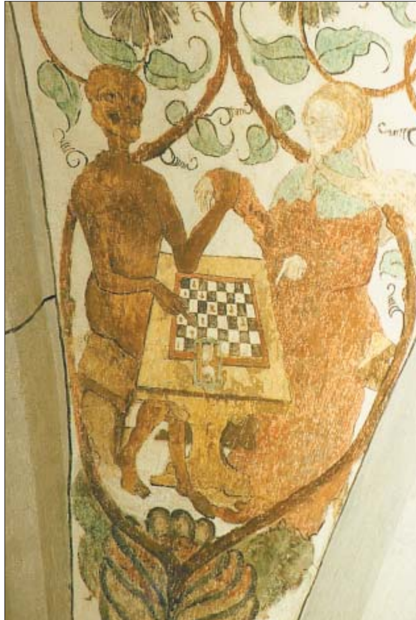
Nach der Reformation versteckt: Die Abbildung des Todes als Schachspieler in Ilanz ist in ihrer Art einmalig.

Viel Aufmerksamkeit schenken die Teilnehmenden des letztjährigen Kongresses in Gent (Belgien) auch den Todesbildern in der protestantischen Kirche St. Margrethen in Ilanz. Dies, zumal es unter diesen Darstellungen gibt, die in allen anderen bekannten Totentanz-Serien und anderen Reihen nicht oder nur äusserst selten vorkom-